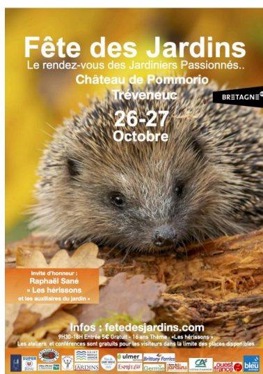
Château de Pommorio (22) Fête des jardins