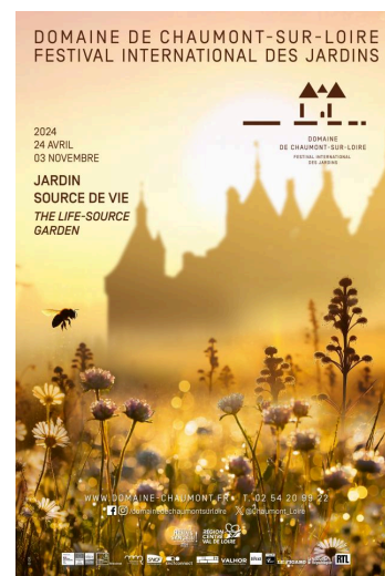
Domaine de Chaumont-sur-Loire Festival international des jardins