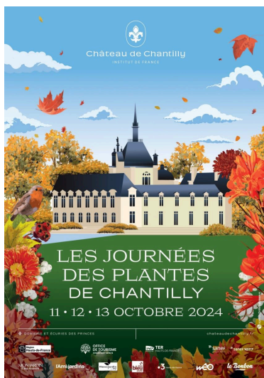
Domaine de Chantilly Journée des plantes