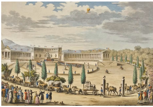
TelaBotanica - Vu sur la Toile #268