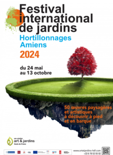
Hortillonnages - Amiens Festival international de jardins #15